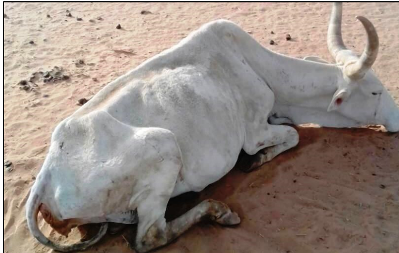
Vache épuisée dans le Ferlo Sénégalais