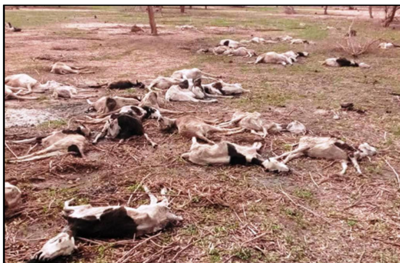
Petits ruminants retrouvés morts après les premières pluies

Pour l'aliment de bétail concentré, le sac de 40 kg est vendu de 5 200 FCFA (pour l'aliment de l'opération sauvegarde du bétail subventionné) à 12 000 FCFA et même plus et même plus avec les commerçants, en passant par 7 500 FCFA (pour l'aliment PROPILAB)