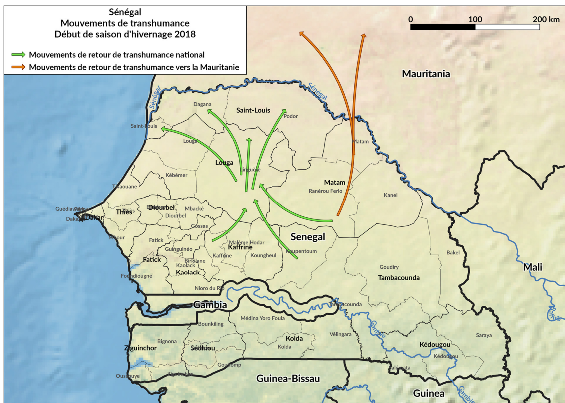
Cartes des mouvements de transhumance sur le Sénégal

En outre, il faut signaler que la traversée de la vallée du Ferlo, à hauteur de Thioukoungal, de Gniwa et de Porane représente un grand risque pour les transhumants du département de Podor et aucune infrastructure de traversée n'est construite.