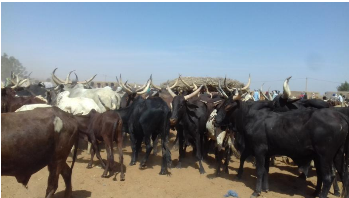
Marché à bétail de Fatoma, Région de Mopti, Mars 2019