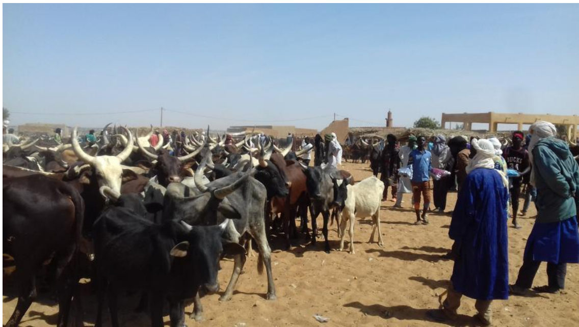
Photo : Marché de Wabaria, région de Gao au Mali, Mars 2019.